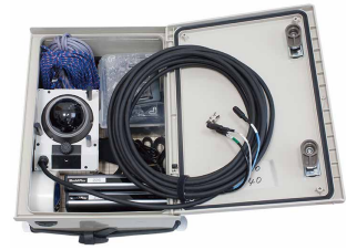
カメラ・付属品・収納BOX

ビューポール®は、振り出し構造のポールを使用した高所ビデオ調査機材です。照明柱や標識柱などに添え付けて、最大10mの高さからビデオ撮影ができます。重量4.9kgのポールとコンパクトに収納された付属品で簡単に高所撮影ができます。機材の設置・撤去は全て地上でできるため、高所作業車による従来の撮影と比べて安全性・経済性が大幅に向上しました。さらに、防滴カメラを搭載することで、天候に左右されない撮影を行うことができます。バッテリー駆動なので電源の無い屋外調査にも適した撮影機材です。